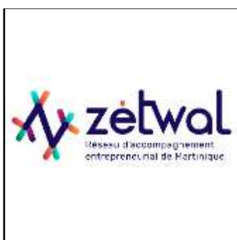
Site de la collectivité territoriale de Martinique https://www.zetwal.mq