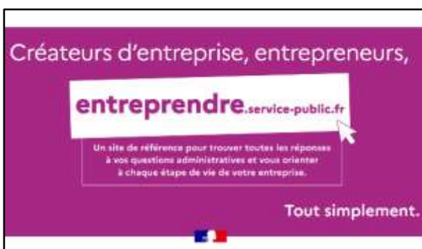
Site d'informations https://entreprendre.service-public.fr

Pour démultiplier son impact , le service a donc vocation à être accessible depuis toutes les ressources destinées aux entreprises. La priorité a été de l'intégrer sur le site d'information et d'orientation des entreprises entreprendre.service-public.fr . Dans une logique d'État plateforme, le service est également présent dans d'autres outils thématiques (simulateur pour l'embauche d'un salarié, moteur de recherche d'aides à la transition écologique) ou portés par des collectivités territoriales comme la Martinique.